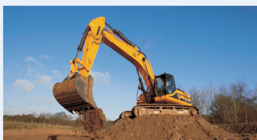
Гусенечный экскаватор JS 330