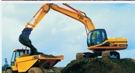
Гусенечный экскаватор JS 220